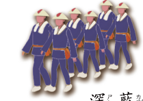
深 ㄕㄞˊ 藍 ㄌㄢˊ 色 ㄕㄨㄣˊ