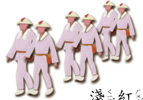
淺 ㄑㄧㄢˊ 紅 ㄏㄥˊ 色 ㄕㄨㄣˊ