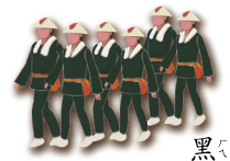
黑 ㄏㄟ 色 ㄕㄨㄣˊ