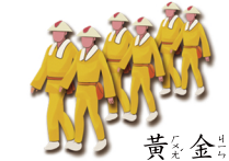
黃 ㄏㄨㄤˊ 金 ㄐㄩㄣˊ 色 ㄕㄨㄣˊ