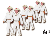
白 ㄅㄞˊ 色 ㄕㄨㄣˊ