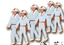
淺 ㄑㄧㄢˊ 花 ㄏㄨㄚˊ 色 ㄕㄨㄣˊ