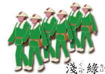
淺 ㄑㄧㄢˊ 綠 ㄌㄨˊ 色 ㄕㄨㄣˊ